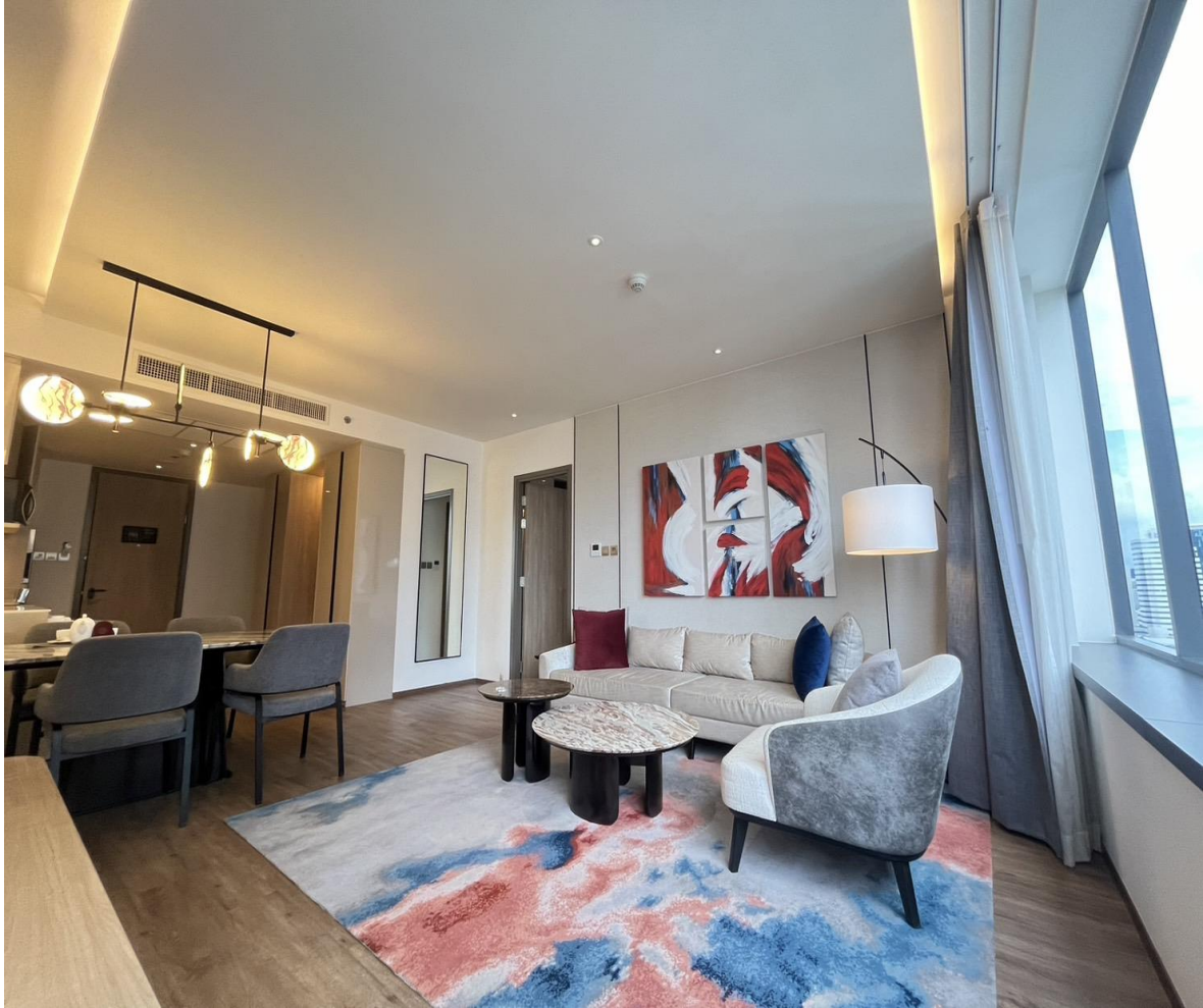
รูปที่ 8 แสดงห้องพักโครงการ และผังแสดงทางหนีไฟที่ประตูห้องของโครงการ