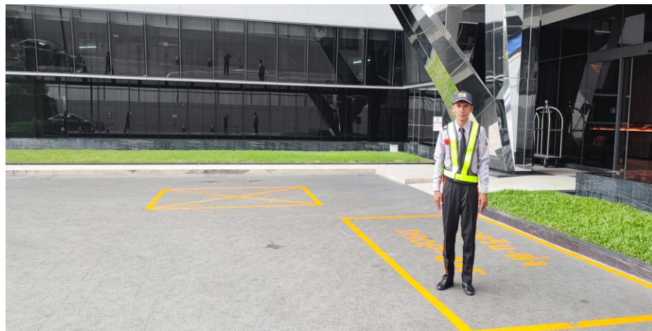
รูปที่ 3 แสดงเจ้าหน้าที่อำนวยความสะดวก ประจำพื้นที่บริเวณที่จอดรถ