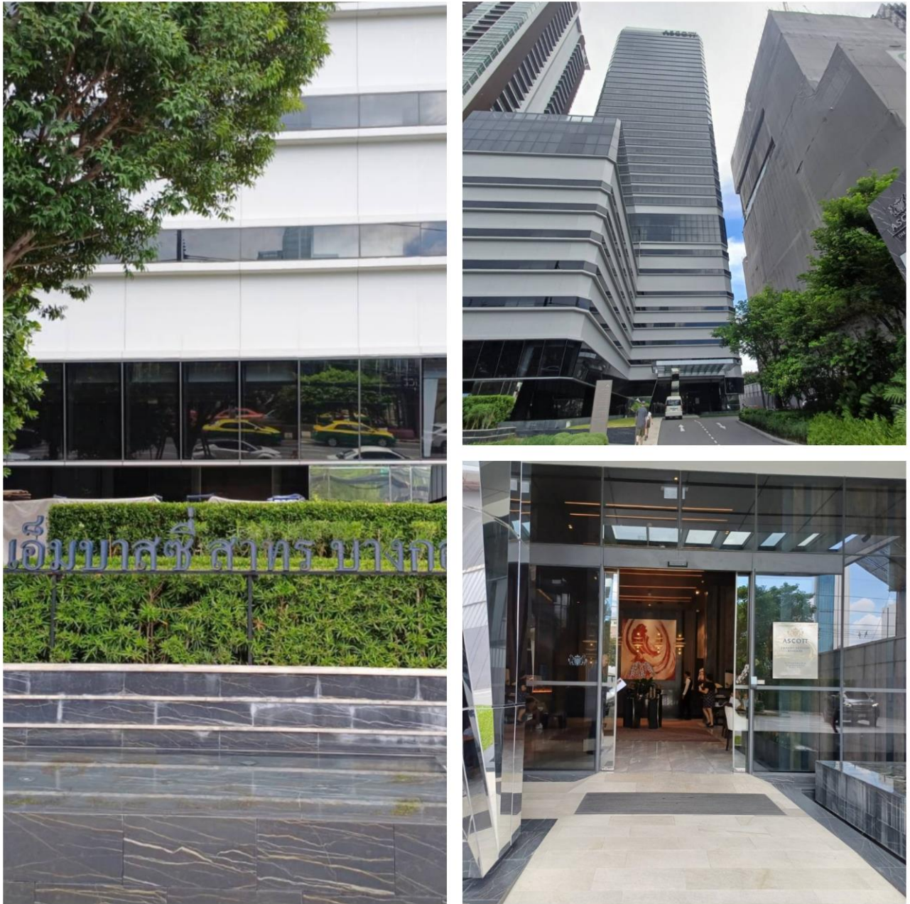
รูปที่ 10 แสดงด้านหน้าของโครงการ