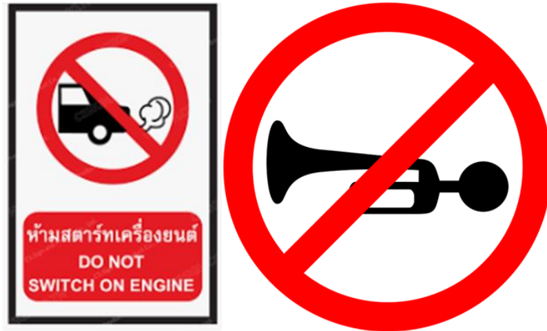
รูปที่ 6 ป้ายห้ามติดเครื่องยนต์ทิ้งไว้ภายในบริเวณพื้นที่จอดรถโครงการ