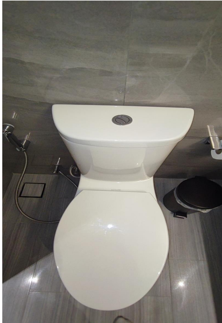
รูปที่ 5 แสดงสุขภัณฑ์ประหยัดน้ำของโครงการ