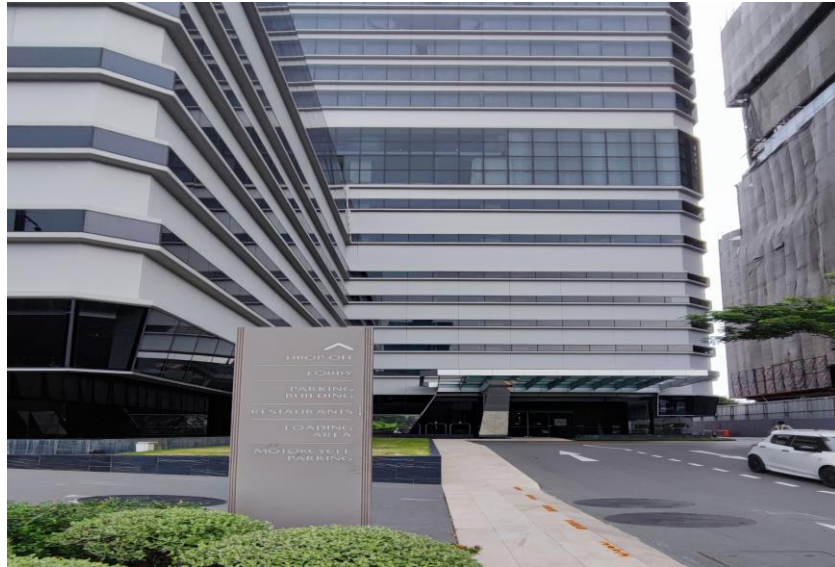
รูปที่ 2 แสดงทางเข้า-ออกโครงการ