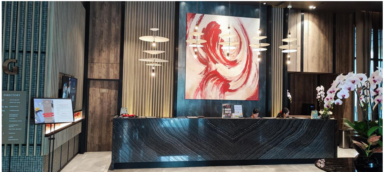
รูปที่ 7 พนักงานต้อนรับภายในบริเวณพื้นที่โครงการ