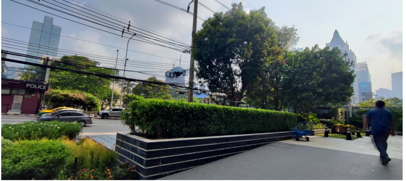
รูปที่ 9 แสดงต้นไม้ของโครงการ