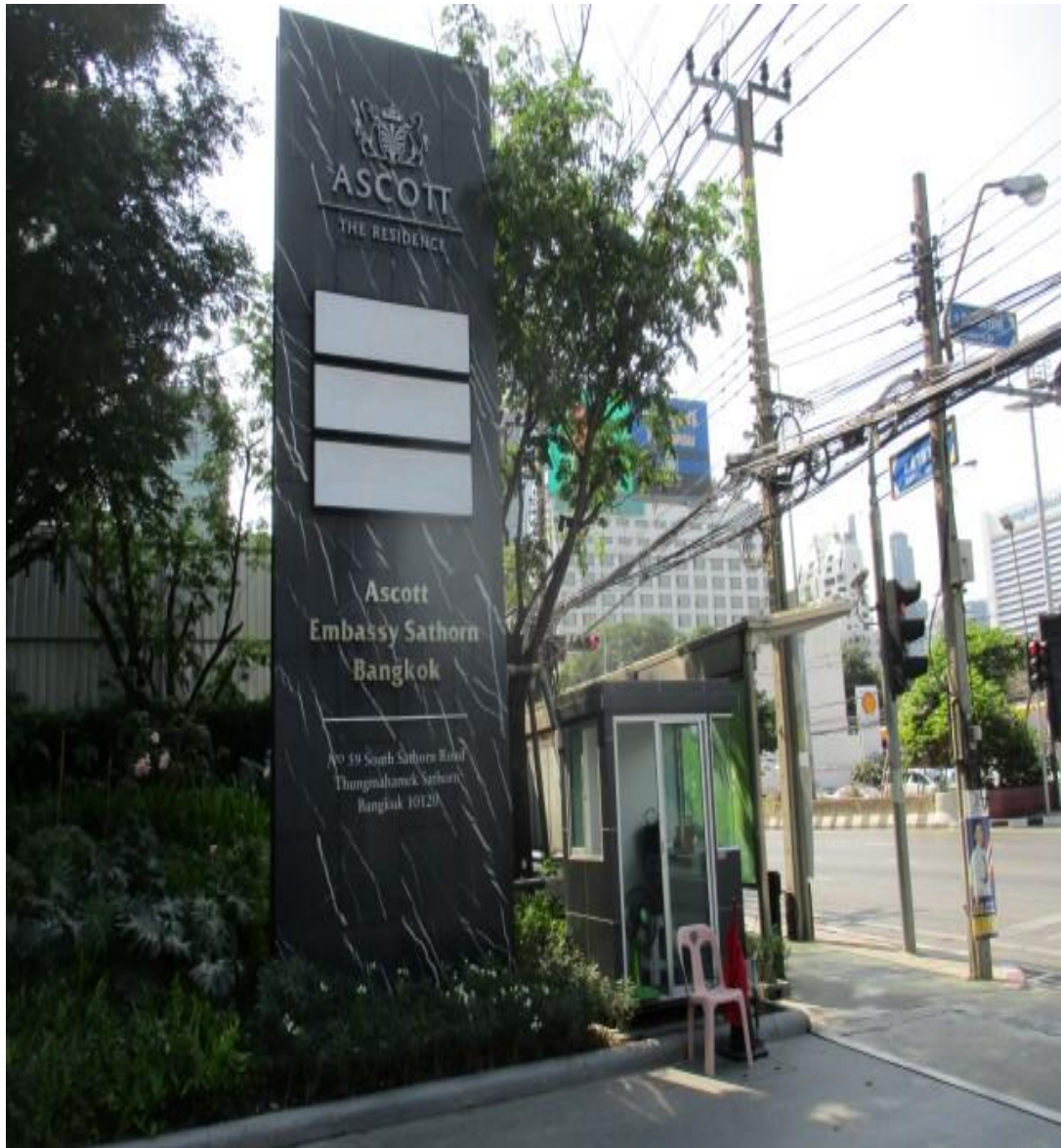
รูปที่ 4 แสดงป้ายชื่อโครงการชัดเจน