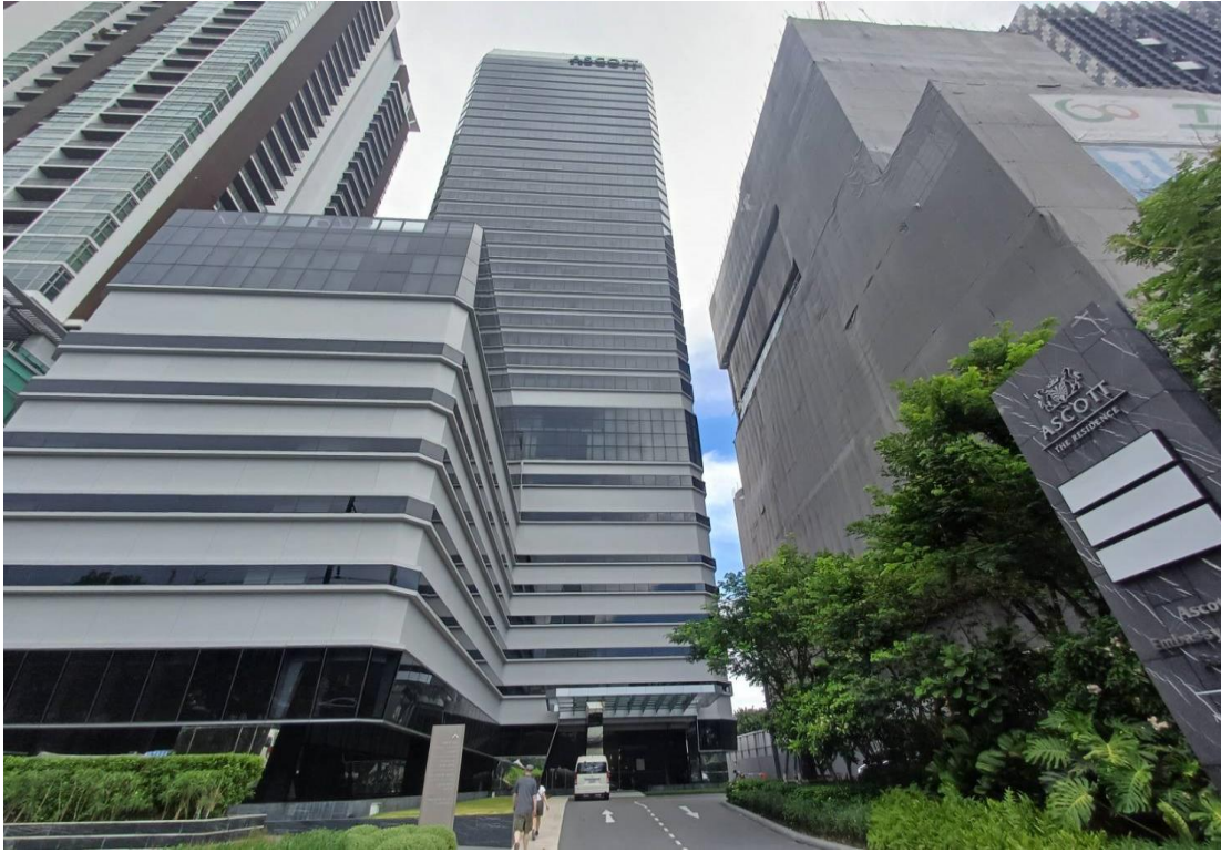
รูปที่ 1 แสดงอาคาร ณ ปัจจุบัน