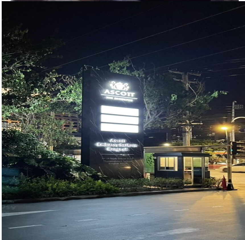
รูปที่ 12 แสดงแสงสว่าง-สวน-ป้ายโครงการ